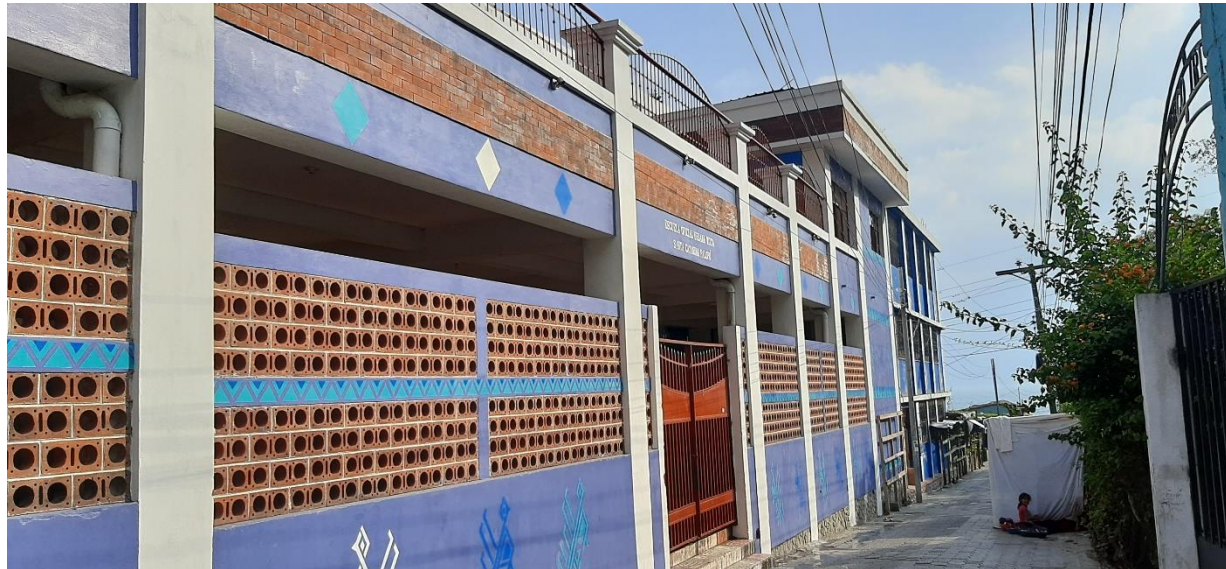
Tabla No.5: Establecimientos Educativos en Santa Catarina Palopó.

La formación educativa de la población es el elemento primordial del desarrollo socioeconómico. El Estado reconoce el derecho a la educación, como lo indica en el artículo 71 de la Constitución Política de la República de Guatemala. Por lo tanto, en la actualidad la educación en el municipio de Santa Catarina Palopó se encuentra conformado de la siguiente manera: